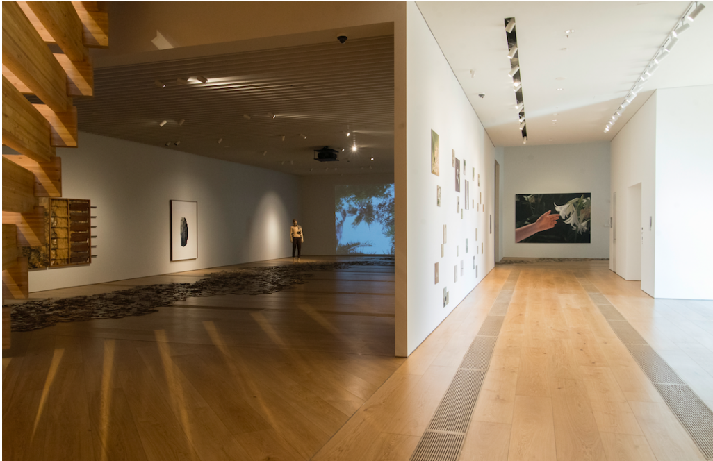
"Günün Sonunda" sergisi, OMM 2020, fotoğraf Ünal Usta

"Günün Sonunda", içinden geçtiğimiz pandemi döneminde, insanlığın Sanayi Devrimi'nden bu yana doğaya verdiği zararın ve ekolojik dengenin bozulmasının sonuçlarıyla yüzleşmeye başladığına dikkat çekiyor. Küresel iklim değişikliği kaynaklı doğal felaketler, henüz yalnızca başlangıcını deneyimlediğimiz büyük bir göç dalgası ve günümüzün sorunlarına çare üretemeyen sistemleri insanlığa hatırlatan pandemi, herkesin bu konular üzerine yüksek sesle düşünmesine sebep oldu. Bu düşünme sürecinden ilham alan sergi şu soruyu soruyor: İnsanın uzun süre merkezine kendisini koyarak bir çeşit sahiplik iddiasında bulunduğu yerküre, "biz" olmadan yaşamaya devam edebilir. Peki türümüz bu bilgiyi özümseyerek doğanın içinde var olmanın daha saygılı yollarını arayacak mı?